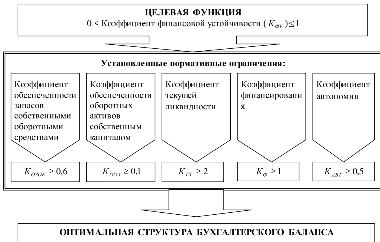
Рис. 2.2. Оптимизация структуры бухгалтерского баланса

характеристикам, поэтому комплекс взаимосвязанных целенаправленных аналитических мероприятий должен быть направлен на корректировку как отдельных финансовых показателей, так и в целом финансового состояния предприятия. При этом инновационные подходы к аналитическим исследованиям предполагают, главным образом разработку и использование таких приемов и методов анализа финансового состояния хозяйствующего субъекта, которые бы носили превентивных характер.