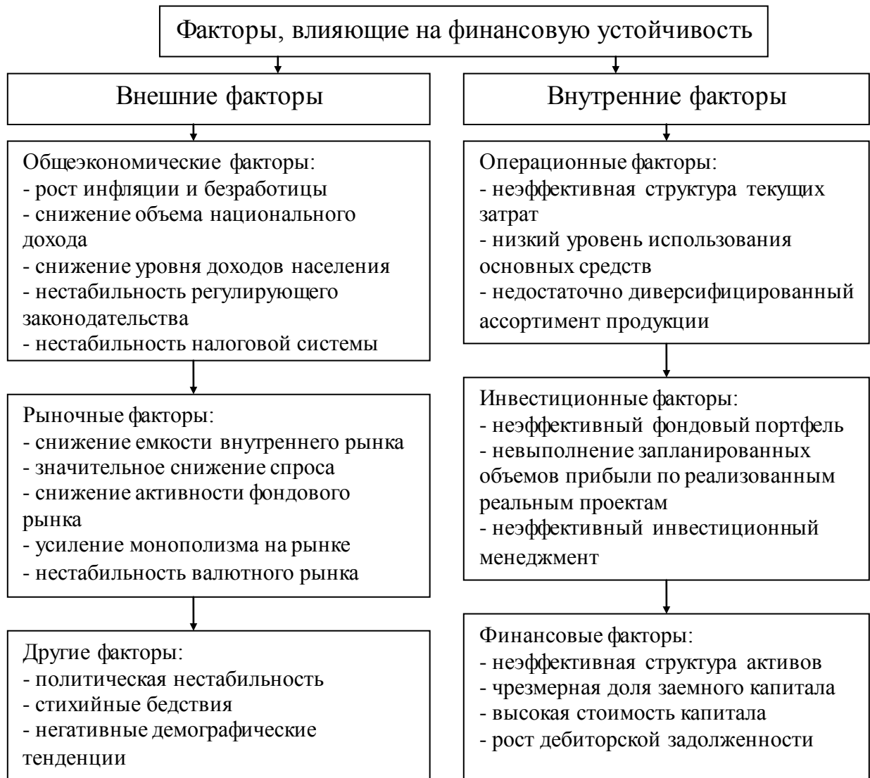
Рис. 1.2. Внутренние и внешние факторы, влияющие на финансовую

Классификация внутренних и внешних факторов, влияющих на финансовую устойчивость предприятия представлена на рисунке 1.2.