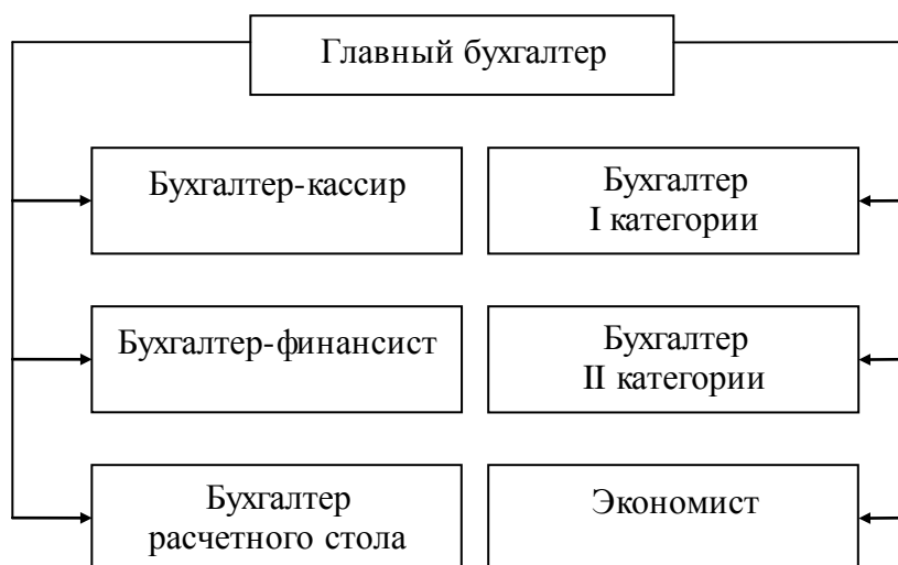
Рис. 1.3. Структура бухгалтерии ОАО Спиртзавод «Бекетовский»

Бухгалтер-кассир осуществляет прием наличных денежных средств в кассу предприятия, выдает наличные денежные средства подотчетным лицам на основании служебных записок, заверенных подписью генерального директора. Также контролирует соблюдение лимита остатка денежных средств в кассе, сдает наличную выручку в банк, получает наличные денежные средства по чеку в банке, ежедневно ведет кассовую книгу и оформляет первичные кассовые документы в соответствии с порядком ведения кассовых операций.