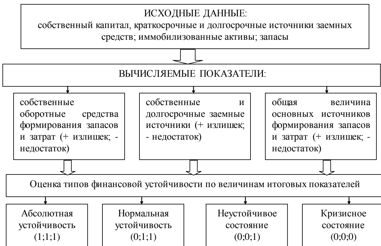
Рис. 2.1. Оценка типа финансовой устойчивости предприятия

Процесс анализа и моделирования финансового состояния хозяйствующего субъекта предполагает решение определенных задач: выбор методов, критериев, показателей и алгоритмов оценки. Последовательность оценки типа финансовой устойчивости предприятия представлена на рисунке 2.1.